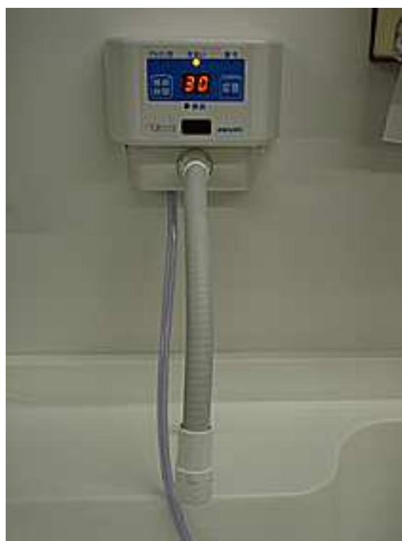
【 専用非接触リモコン蛇口 】