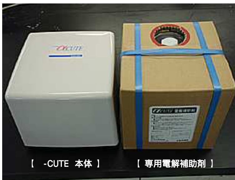
【 -CUTE 本体 】

アmano株式会社 TEL 045(401)1441(代表) ホームページ http://www.amano.co.jp/AET/