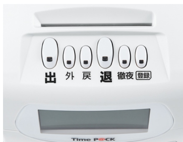
Time P@CK 100