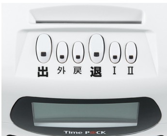
Time P@CK 150 WL