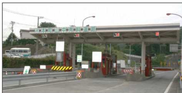
本町山中有料道路