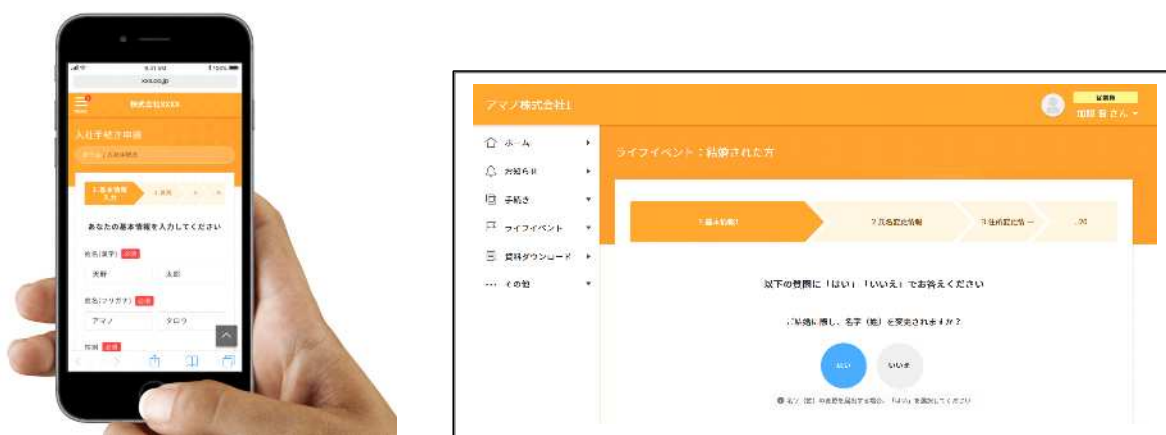
(左:スマートフォンでの申請画面例、右:パソコンでの申請画面例)

スマートフォンやパソコンなどから、簡単操作で届出申請が行えます。社内インフラに接続ができない採用内定者の方でもご利用いただけます。